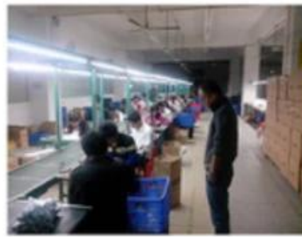
Finished product assembly