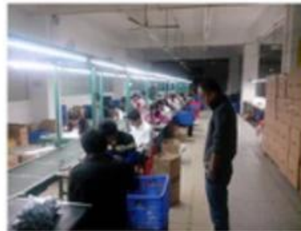
Finished product assembly